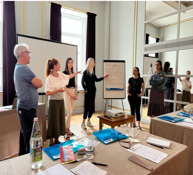
Ομαδική εργασία για το πρότυπο του καθηγητή